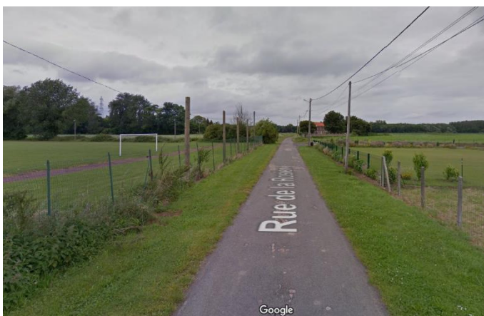
Chemin menant à la ferme