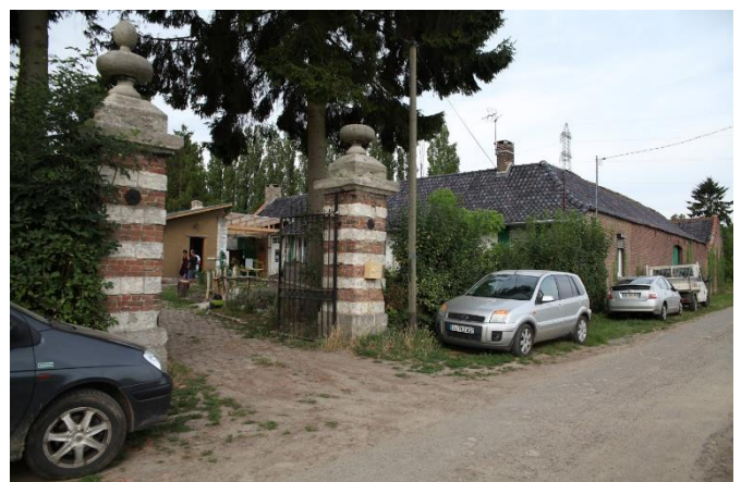
Entrée de la ferme