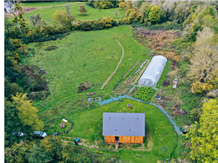
Le design et l'implantation se font progressivement, parfois sur plusieurs années : après la construction de la maison et de la phytoépuration, le potager familial a été créé. Le reste de la pâture (en haut à gauche) est maintenant en cours d'étude et de piquetage.

“ J'ai quitté (partiellement) un monde de croissance matérielle pour une autre forme de croissance. Pas pour plus de PIB, non, pour plus de balades, plus de jardin, plus de lectures, plus d'apprentissages, plus de partages, plus de temps avec les voisins, plus de couture, plus de plantes sauvages, plus de cuisine, plus de bons repas, plus de bons moments. ”